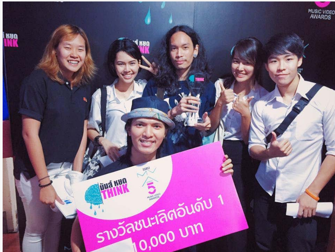
ผลงานที่คว้ารางวัลชนะเลิศจากงาน SSRU MV AWARDS VOL.5