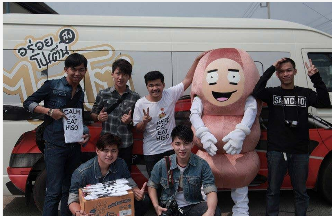
คว่ำรางวัลชนะเลิศการประกวด กิจกรรม Hiso Challenge "แมลงทอดไฮโซ"